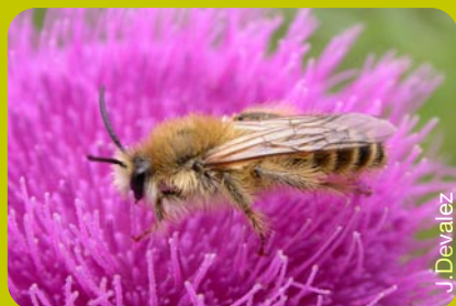
Femelle de Dasypoda hirtipes