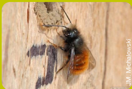
Femelle d' Osmia cornuta