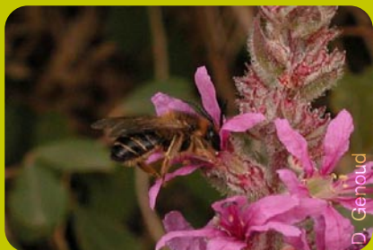
Femelle de Melitta nigricans