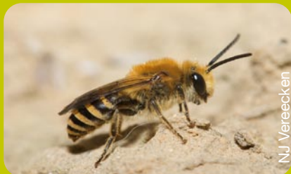
Femelle de Colletes hederæ