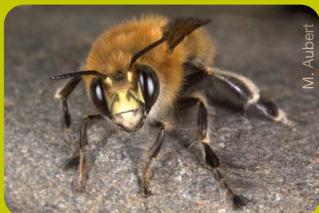
Femelle d' Anthophora plumipes