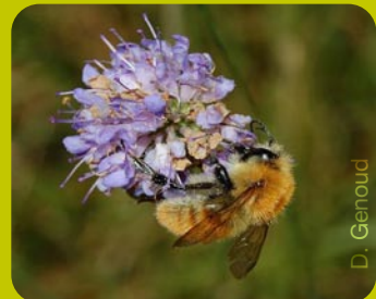
Femelle de Bombus pascuorum